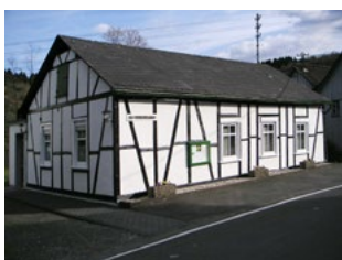
Ev. Vereinshaus Plittershagen Plittershagener Straße 126