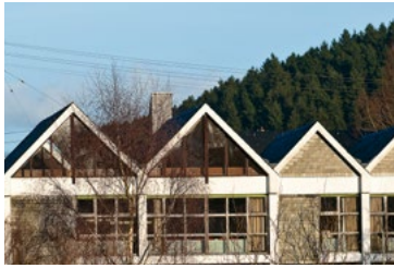
Tillmann-Siebel-Haus Krottorfer Str. 37