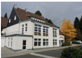
Ev. Gemeindezentrum Büschergrund Mühlenstr. 25