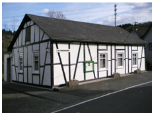
Ev. Vereinshaus Plittershagen Plittershagener Straße 126