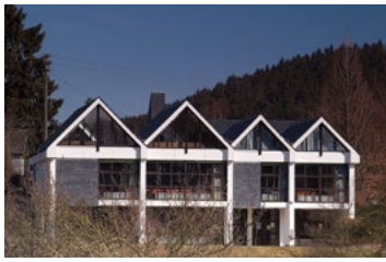
Tillmann-Siebel-Haus Krottorfer Str. 37